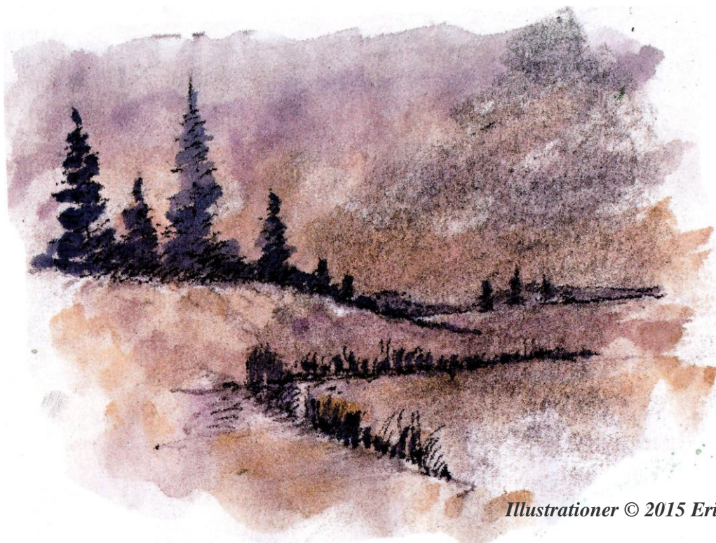
Illustrationer © 2015 Erik Bay