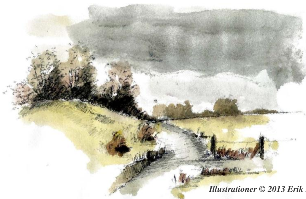
Illustrationer © 2013 Erik Bay