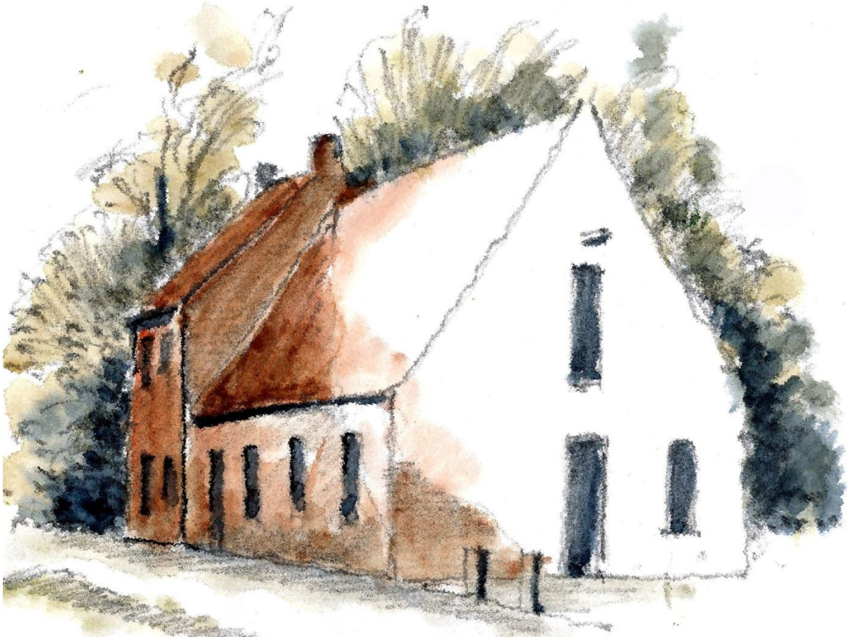
Fuglevad Vandmølle, Møllevej 4, 2800 Kgs. Lyngby – Illustration af Erik Bay