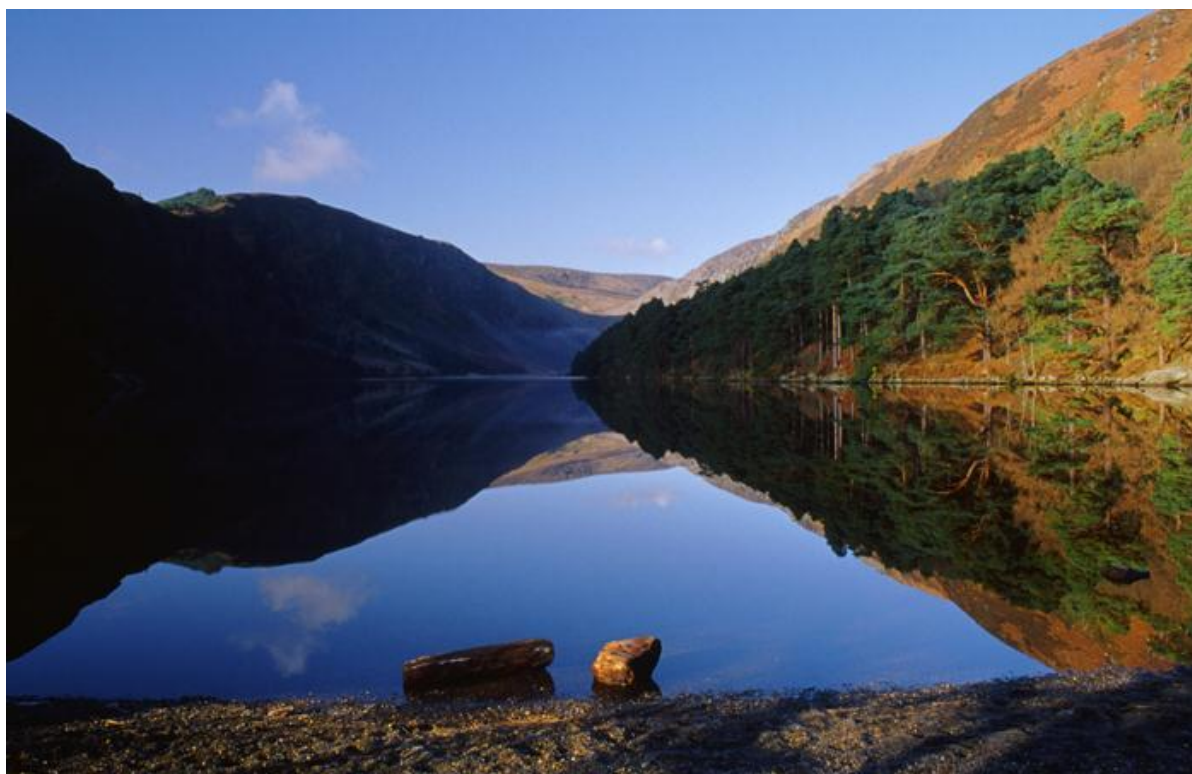
Glendalough - Upper Lake - i Wicklow Mountains