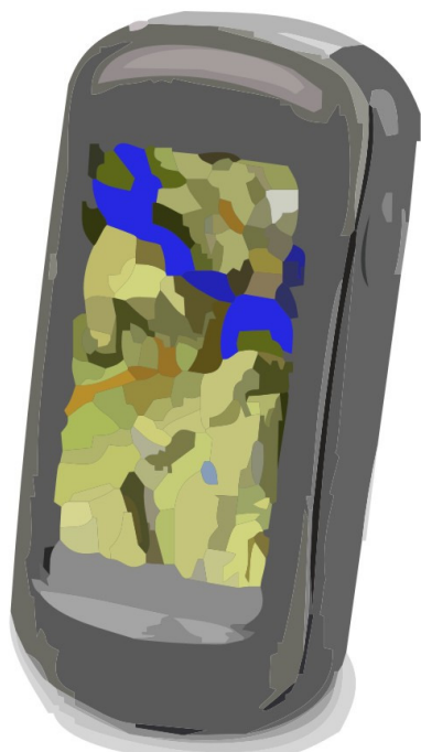
Tegning: Søren P. Petersen