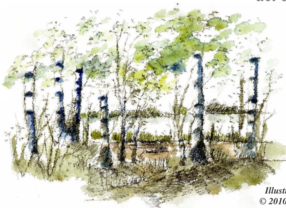
Illustrationer © 2010 Erik Bay