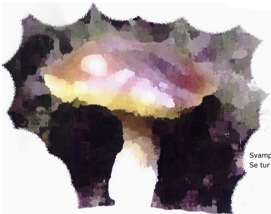
Svampetur af Erik Bay. Se tur 11/10.