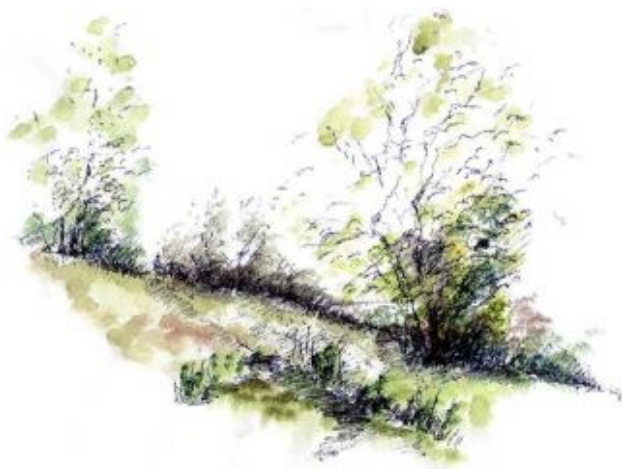
Billede: "Du danske sommer" af Erik Bay