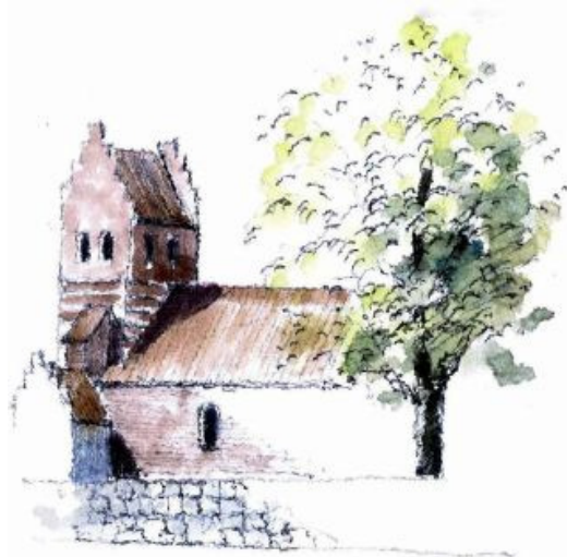
Billede: Sct. Nicolai Kirke i Køge ca. 1150.