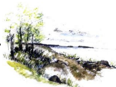
Billede: Stranden ved Boserup Skov. Erik Bay