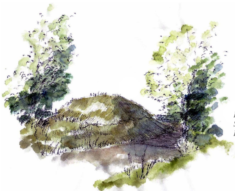
Kongshøj ved Bognæs Se tur 31/8. Illustration: Erik Bay